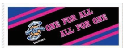
タオル 2色 (白・黒)