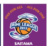
Tシャツ 3色 (黒・紺・紫)