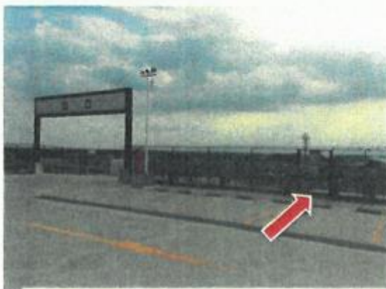
非常階段の出入口 (屋上)