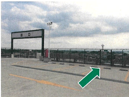
非常階段の徒歩出口（屋上）